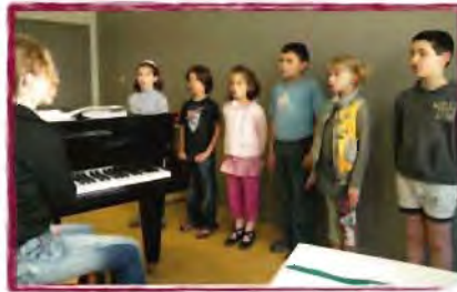
Cours de chant