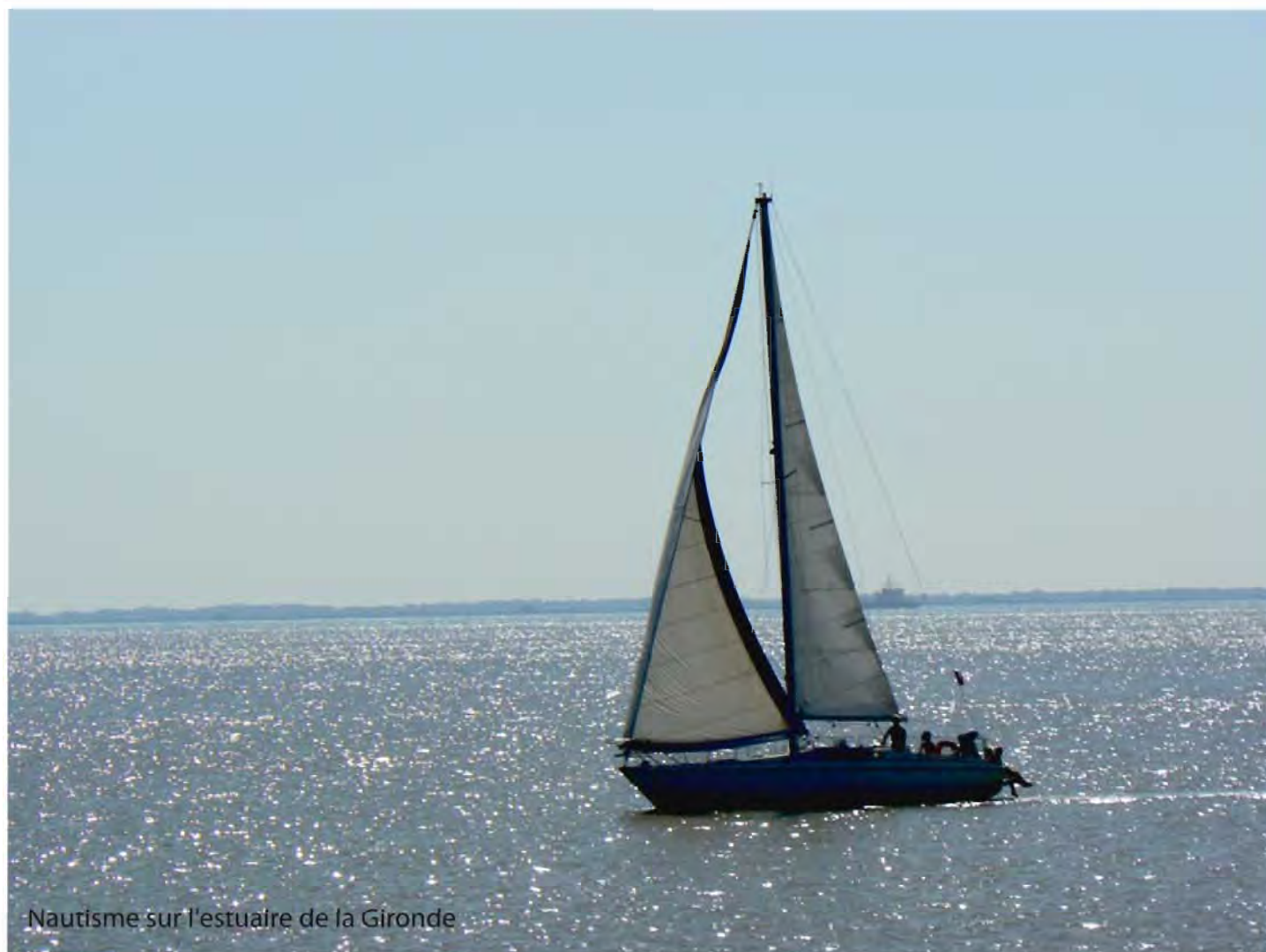
Nautisme sur l'estuaire de la Gironde