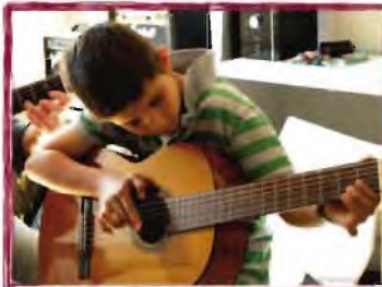
Cours de guitare