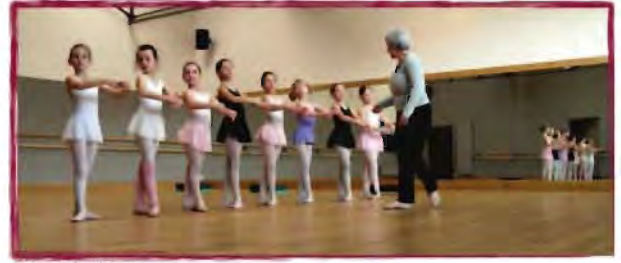
Cours de danse